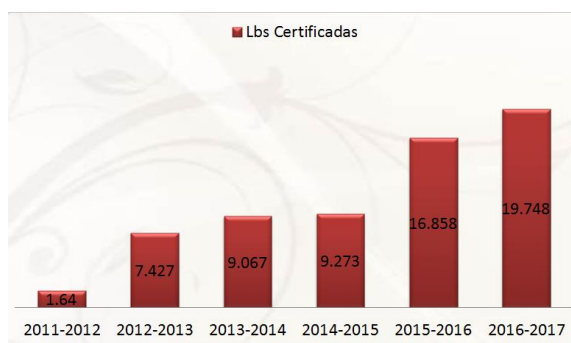
Certificaciones de café tostado y molido / año

El componente técnico operativo de la DO, sigue los lineamientos establecidos en la guía de control de calidad y trazabilidad en cumplimiento al reglamento de uso de la DO café Marcala, en los proyectos se contemplan componentes de investigación, manejo integral de cafetales con enfoque preventivo de plagas y enfermedades, obteniendo productividad sin perder la calidad del grano, beneficiado húmedo, métodos de preparación, secado, tostado y molido del café, implementación de las normas de Adaptamiento al cambio climático en vista que la DO Marcala es experiencia Piloto para implementar la NAMA café a nivel Nacional y en aspectos sociales se trabaja con las redes de mujeres, jóvenes, en procesos de inclusión de la población más vulnerables, todo estos procesos se realizan en coordinación con las organizaciones socias, líderes de las comunidades, gobiernos locales , en estos casos todos los procedimientos se siguen de acuerdo a los requerimientos del financiador.